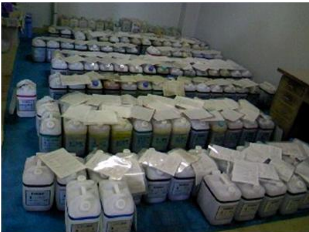
各学部から集められた廃液が、処理を待っている

前回(8月)の処理作業の際は、教職員の方、学生さんなど、多くの方が見学に来てくださいました。事前にご連絡をいただければ、今回も見学することができます。残念ながら、前回見逃してしまった方、興味のある方、是非この機会に足を運んでみてください。