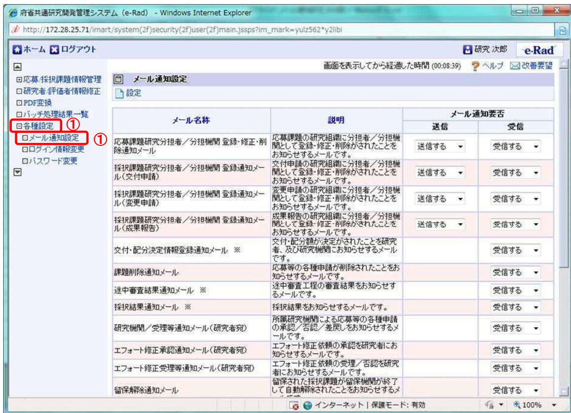
「メール通知設定」画面